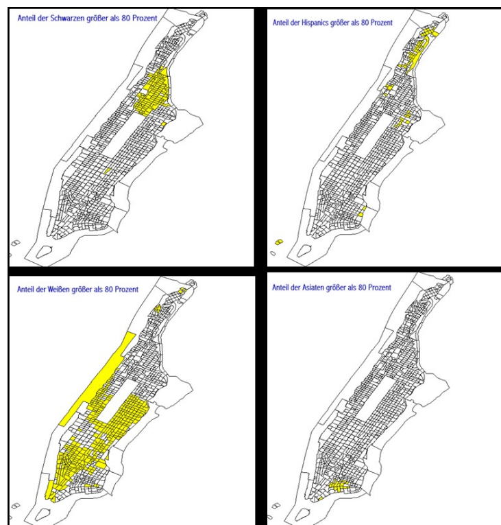
Segregation am Beispiel von Manhattan

räumliche Trennung der Wohnbevölkerung nach sozialen und/oder ethnischen Kriterien